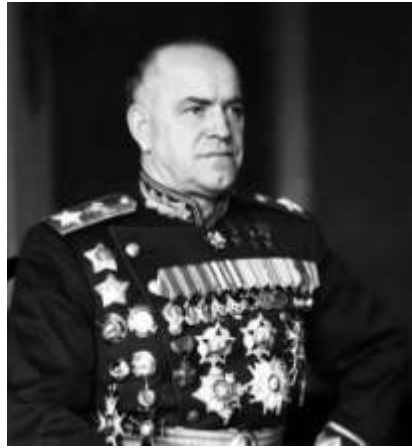
начальник Генштаба Георгий Жуков

В 3.05 первые бомбы упали у Кронштадтского рейда. В 3.07 командующий Черноморским флотом доложил о подходе «неизвестных самолетов» и получил от начальника Генштаба Георгия Жукова разрешение встретить их огнем ПВО.