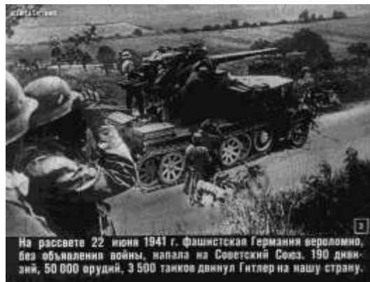
На рассвете 22 июня 1941 г. Фашистская Германия вероломно, без объявления войны, напала на Советский Союз. 190 дивизий, 50 000 орудий, 3 500 танков двинул Гитлер на нашу страну.

«Нет. Нас – солдат Великого рейха – ждет война с самим Советским Союзом. Но нет такой силы, которая смогла бы сдержать движение наших армий. Для русских это будет настоящая война, для нас – просто Победа. Мы будем за нее молиться», - делился своими впечатлениями от этого известия ефрейтор Ганс Тойхлер.