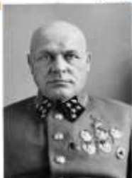
Павлов Дмитрий Григорьевич (1897 г. – 1941 г.)

Дмитрий Григорьевич Павлов – советский военачальник, генерал армии, Герой Советского Союза. Командуя Западным фронтом, принял на себя первый и основной удар немецко-фашистских войск. В короткий срок войска фронта в Западной Белорусии и Минске были разгромлены. Через несколько дней был обвинен в трусости и бездействии, лишен присвоенного ордена и расстрелян. В 1957 г. реабилитирован посмертно, в 1985 г. восстановлен в звании Героя Советского Союза.